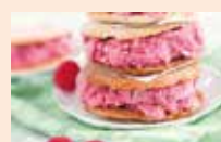
Ica Cream Sandwich Purée Framboise Litchi Citron Vert