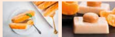
Entremets Purée Mangue Orange Passion

Des recettes chaleureuses et généreuses en goût, idéales l'Automne-Hiver venus ! / Recipes especially warm and rich in tastes, ideal for autumn & winter !