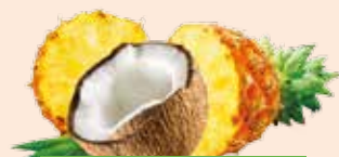
Ananas Coco / Pineapple Coconut