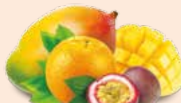
Mangue Orange Passion / Mango Orange Passion fruit