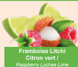
Framboise Litchi Citron vert / Raspberry Lychee Lime