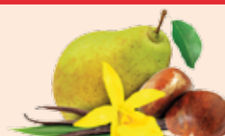
Poire Marron Vanille / Pear Chestnut Vanilla