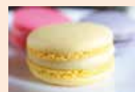
Macaron ganache Purée Ananas Coco

Des recettes sélectionnées et élaborées pour leur caractère frais et intense en goût, idéales au Printemps-Été. / Recipes selected and developed for their freshness and intensity of taste, perfect for spring & summer preparations!