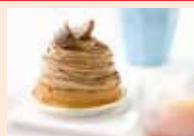
Mont-Blanc Purée Poire Marron Vanille